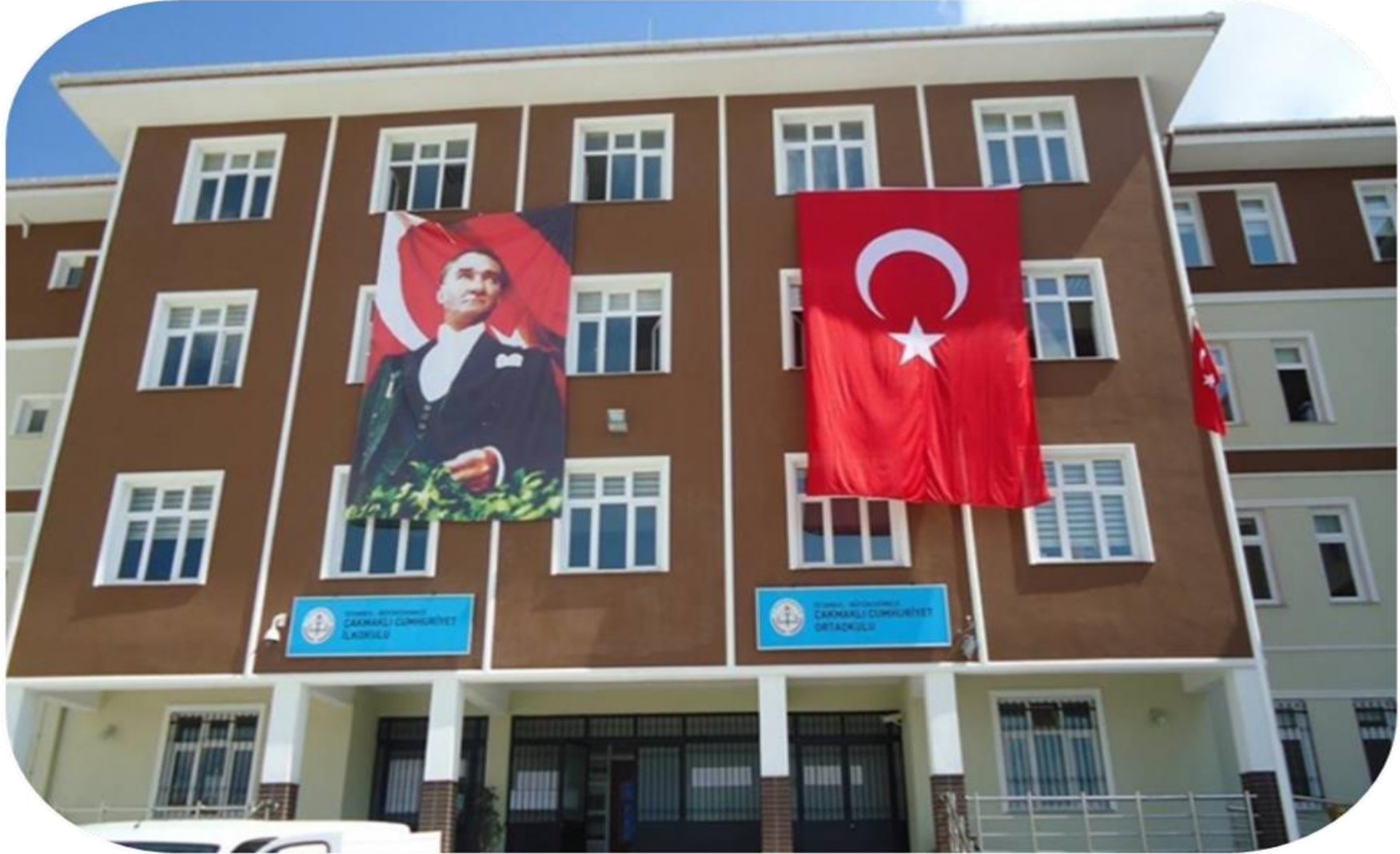
ÇAKMAKLI CUMHURİYET İLKOKULU ÇAKMAKLI CUMHURİYET ORTAOKULU